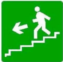
Scala di emergenza